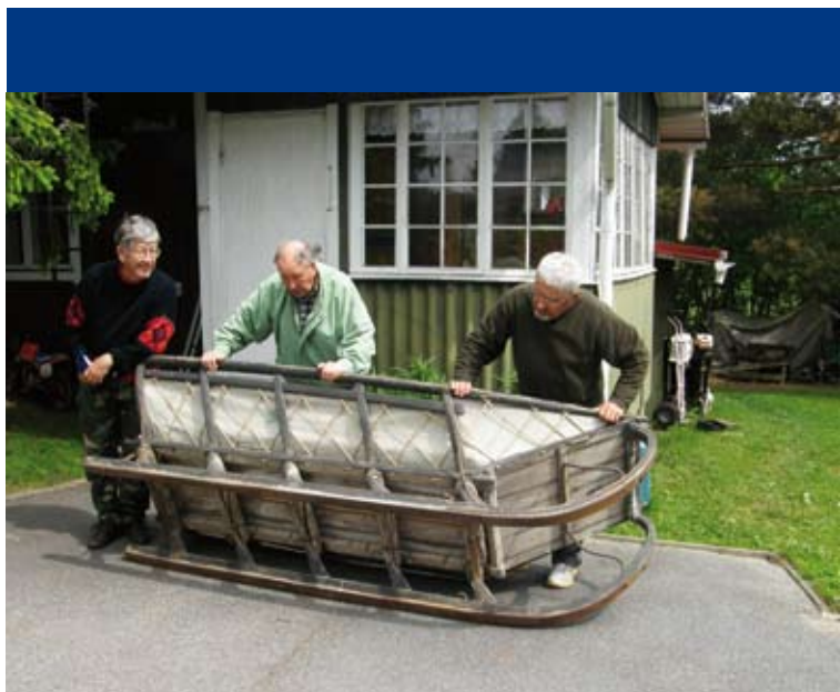
Kyl täst reslareest tul iha hyvä.