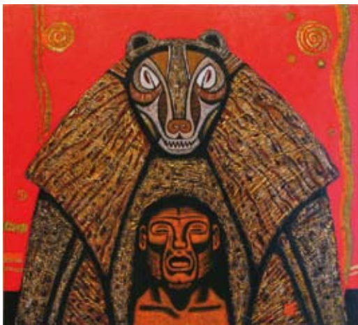
Igor Bacanovin Bear-maalauksessa on särmeä!

Domanderin näyttelyalue on 150 metrin päässä Salmelan päärakennuksesta, ja matkalla voi poiketa myös muutamia maalauksia seinällään pitävässä ravintola Kesäheinässä. Posti- ja