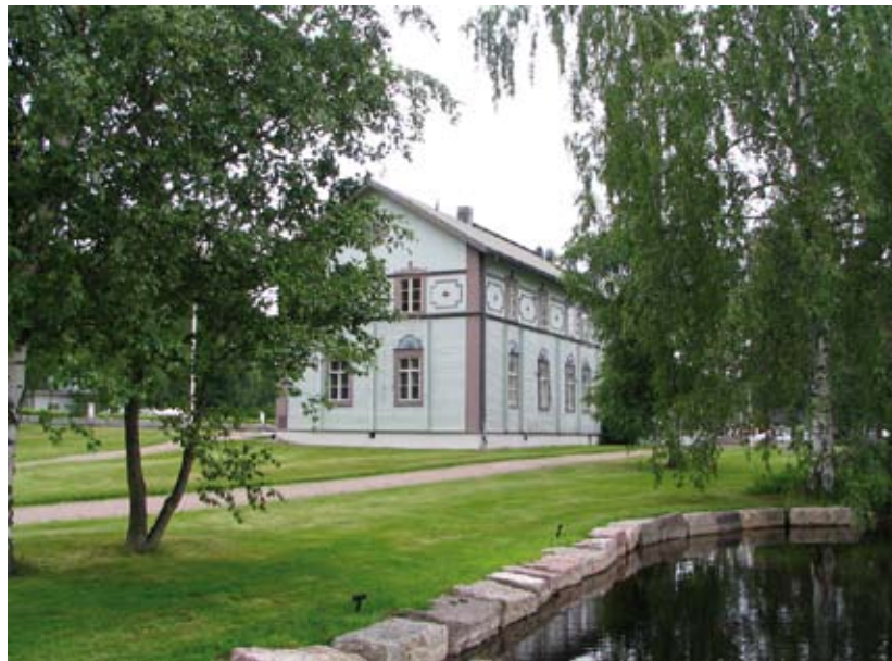
Salmelan päärakennus sijaitsee aivan Pyhäveden rannalla

Mäntyharjun kirkonkylän kauniissa järvimaisemissa toimiva Taidekeskus Salmela on hieno paikka. Vanha, hyvinhoidettu Salmelan puinen päärakennus, näyttelytiloina toimivat kirkonkylän vanha posti- ja apteekkitalo sekä piha-aitat saavat arvoisensa ympäristön kauniista järvimaisemasta ja vehreistä nurmialueista. Kesäpäivää voisi hyvin viettää vain Salmelan piha-alueita ja sen huvimajarakennuksia tarkastellen.