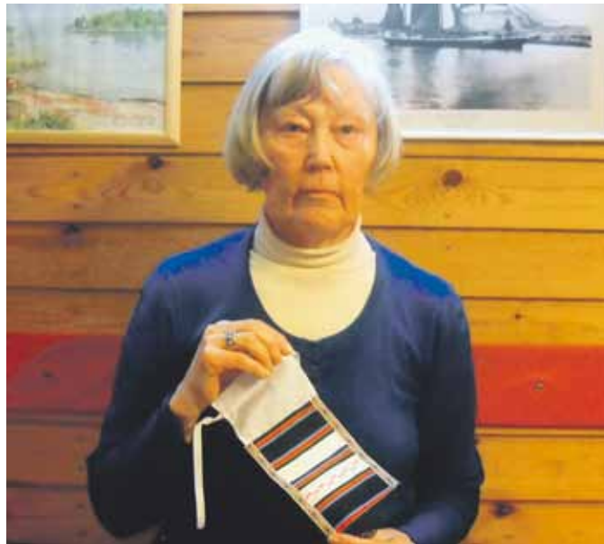
Kaisa ja eka essu