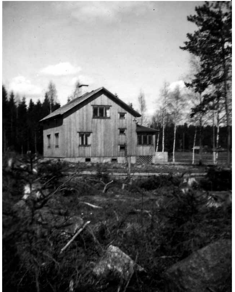
Ilmastin juuri valmistunut talo.

Muistan tapauksen, kun kovien sateiden jälkeen pellon kanta-oja ei jaksanut vetää ja vesi nousi laajalle alalle laakealla pellolla. Alkutilven pakkaset jää- dyttivät pellolle nousseen veden ja siitä muodostui talven ensim- mäinen luistinrata. No, kylän lapset valloittavat "luistinradan" ja lätkämätsit alkoivat. Viidak- korumpu koulussa viestii hyvästä luisteluradasta ja seuraavina päi- vinä pellolla on tungosta. Tästä- hän pellon omistaja ei pitänyt al- kuunkaan ja luistelijat häädetään kovaäänisesti luistinradalta. Kek- seliäinä poikina menemme kui- tenkin illan pimetessä takaisin. Seuraavana päivänä illan pime- nemistä odotetaan pitkäjännit- teisesti. Vihdoin tuli riittävän pi-