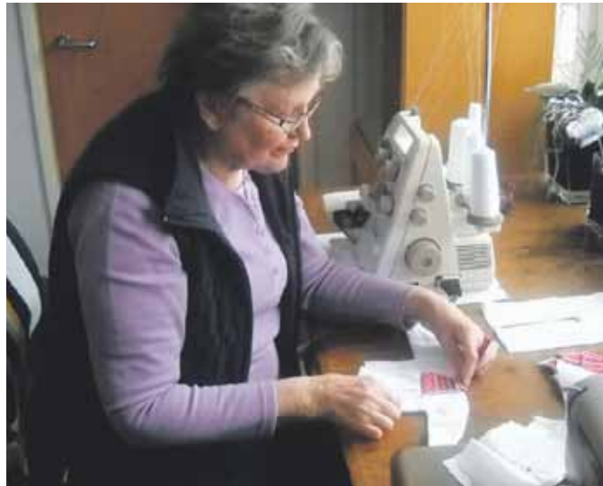
Kyllikki rekon teossa