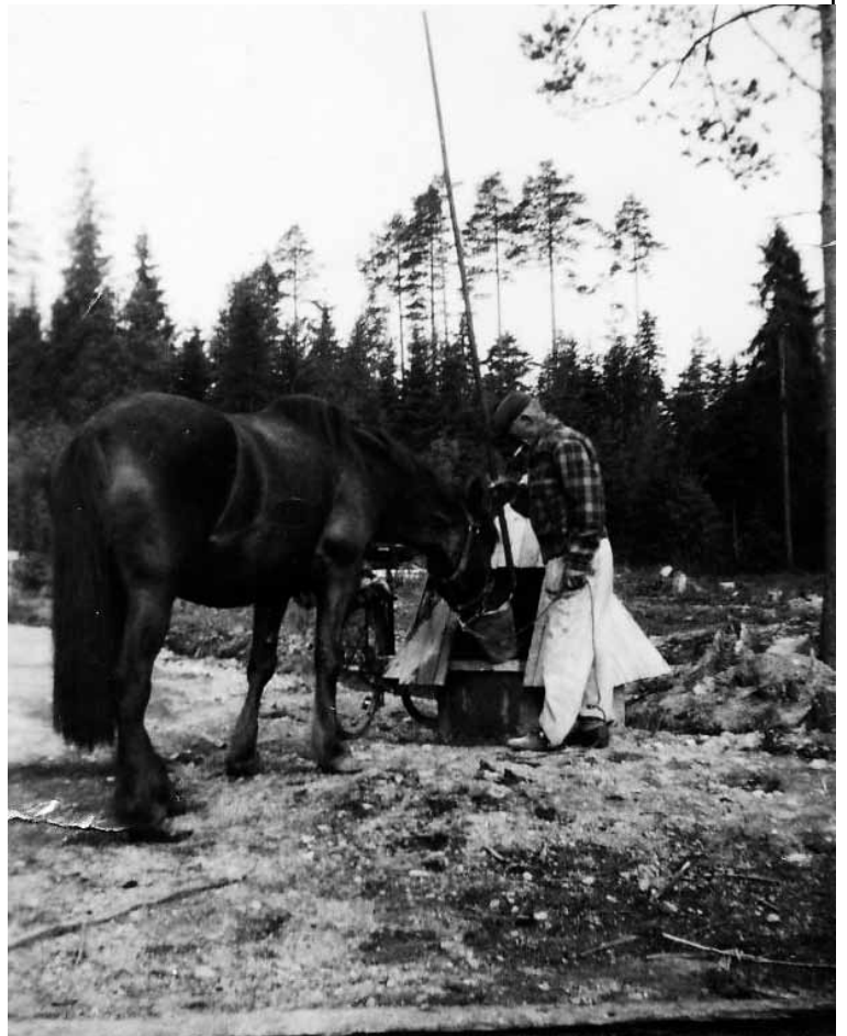
Äijä ja hevosensa Poku.

meää ja ei muuta, kuin luistimet jalkaan ja jäälle. Jo ensimmäisien vetojen jälkeen selviää, että jää on tehty luistelukelvottomaksi, kun