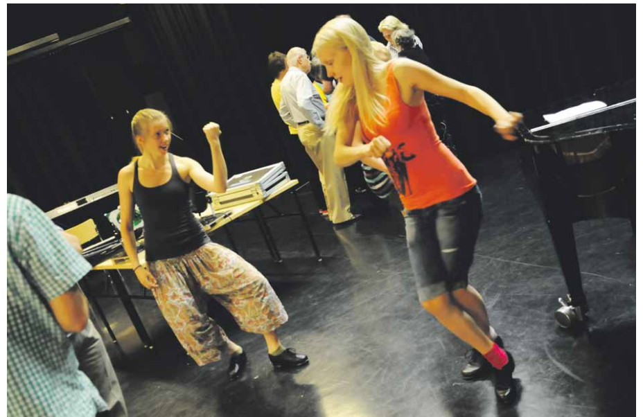
Muistojen illan kupletti-iltamat vievät juhlaväen aina Hollywoodiin saakka. Steppiryhmällä vielä glamour hakusessa.