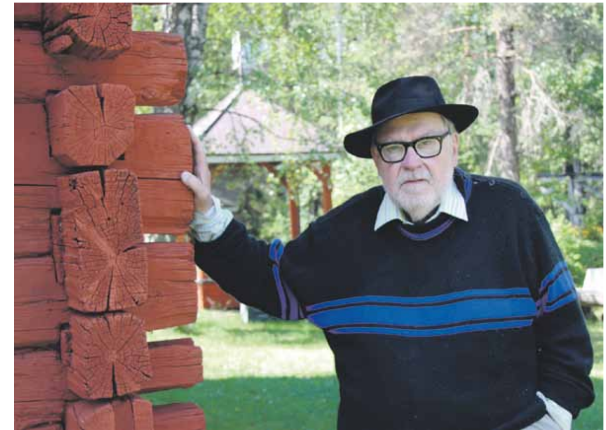
Suururakka on tehty; viisiosainen Yhteisön voima – Nuorisoseuraliikkeen historia on valmis. Ministeri Jaakko Numminen osoittaa kiitoksensa niille lukuisille henkilöille ja tahoille, jotka ovat antaneet apuaan teossarjan eri vaiheissa.

Ministeri Numminen kertoo, että lähes jokainen suomalainen on joutunut tekemisiin nuorisoseuraliikkeen kanssa, jollei muuten niin käymällä seurantalossa iltamassa, juhlassa tai tansseissa. Nuorisoseurat ovat toimineet etupäässä maaseudulla, joskin 1800- ja 1900-luvun taitteessa oli myös voimakkaita kaupunkinuorisoseuroja. Lukuisista perheistä nuorisoseuroissa on toiminut kolme, jopa neljä sukupolvea. Alkuaikoinaan nuorisoseurajärjestö oli varttuneen nuorison liike, mutta sittemmin seuroihin on kuulunut kaikenikäisiä, ja 1900-luvun loppupuoliskuympäristössä on korostunut varhaisnuorten, Kalevan nuorten, osuus.