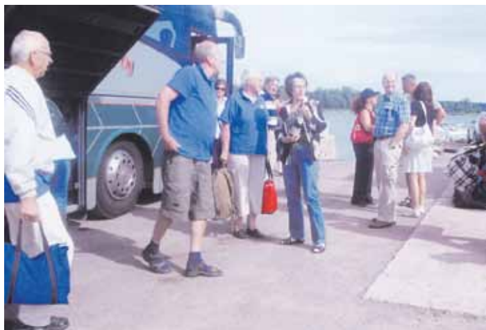
Olimme saattamassa Saarenpään lähtijöitä

tuli mukaan ostettua. Myöskin saimme ihailla Tervahartialan kauniita hiekkarantoja ennen omaan kotikylään Penttilään tuloa.