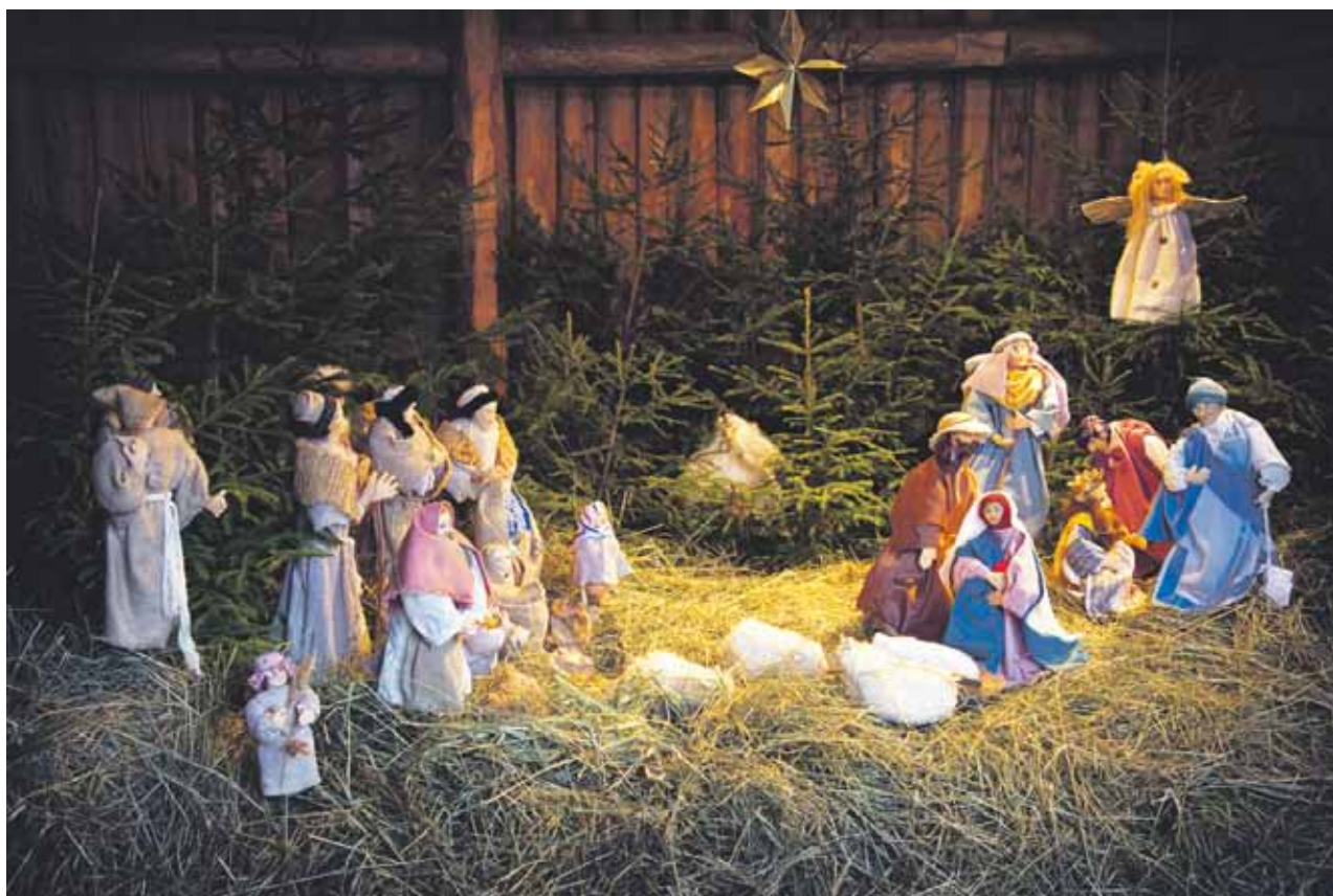
Seimi Turun Kotiseutumuseon näyttelystä.

Rakas puolisoni, isämme, isoisämme, vuorineuvos