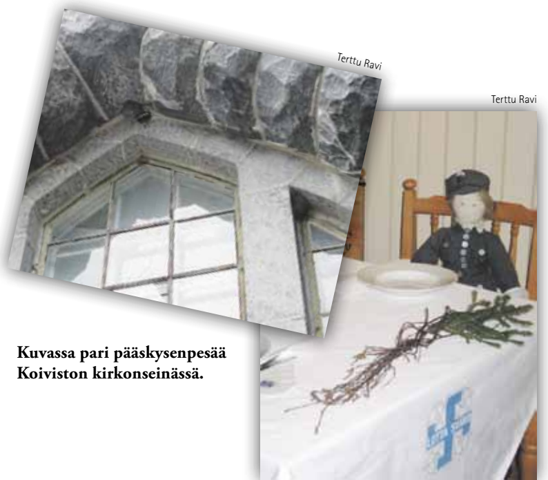
Kuvassa pari pääskynpesää Koiviston kirkonseinässä.

ripuut" sekä joutsenessa ollut hiekka oli haettu Koivistolta Tervahartialan rannasta tänä kesänä.