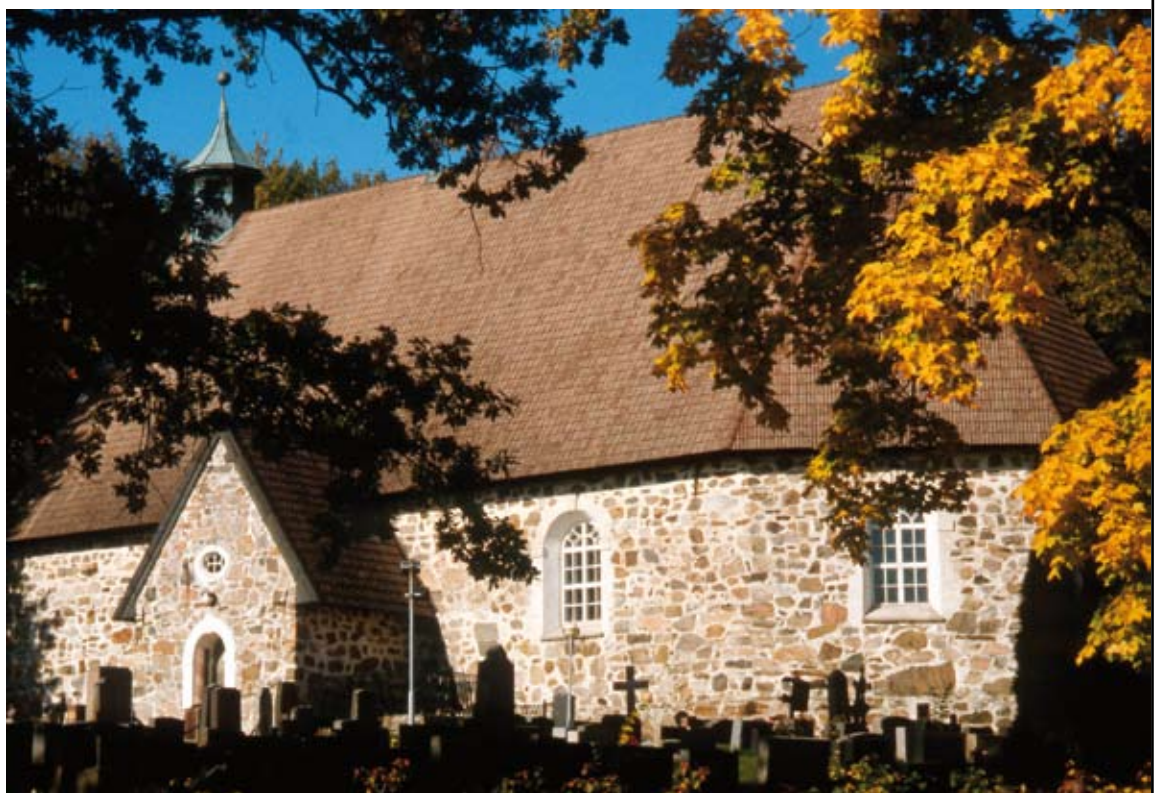
Piikkiön kivikirkko rakennettiin vuosina 1752-1755

Vaikka Piikkiön pitäjä oli pieni, vain pieni osa asutuksesta sijaitsi yli 5 kilometriä linnuntietä kirkosta, on alueella useitakin jopa maailmanluokan kohteita.