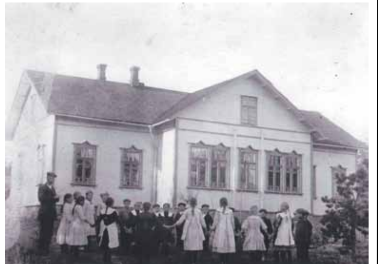
Kuirlahden ja Soukan yhteinen kansakoulu

Kirkko ol mäe pääl, joka ol paha kiivetä ylös. Äitikii nahkakenkissään män polvilee rintees. Kirko pihal ol paljo väkkee. Kirkos istuttii penkis. Virsii ku veisattii ni se tuntu mukavalt, mut ku pappi rupes saarnaama ni sit miulle kävi aika pitkäks. Kirko lattiaa tutkin ja sen muistan minkälaine vähä huonokuntone se ol, mut papi saarnast en muista mittää.