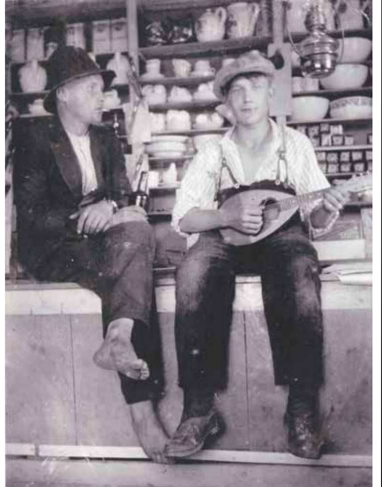
Pojat Mannonesn kauppassa Kuirlahdella 30-luvulla

Naisii tul rantaa pitkis hammeis olliit hieno näkösi, mut kettää muita lapsii ei olt lähös. Venettä ol siivottu. Vennees ol kaks airoparrii. Kokas istu yks naine Äiti asettu soutamaa, ja pist miun istumaa keskiipiitalle kahe naise välillä, jost hää näki miut koko ajan. Peräs ol toine soutaja ja peräs istu viel yks naine. Nii sit souveltii pienes myötätuuless kirko rantaan mis äiti katsel tuttuu venevalkamapaikkaa, mut ei löytänt. Nii sit karautettiin rantaan ja keulanaine hyppäs rantaan ja nykäs venettä nii myö muut päästii kuivi jaloin rantaa.