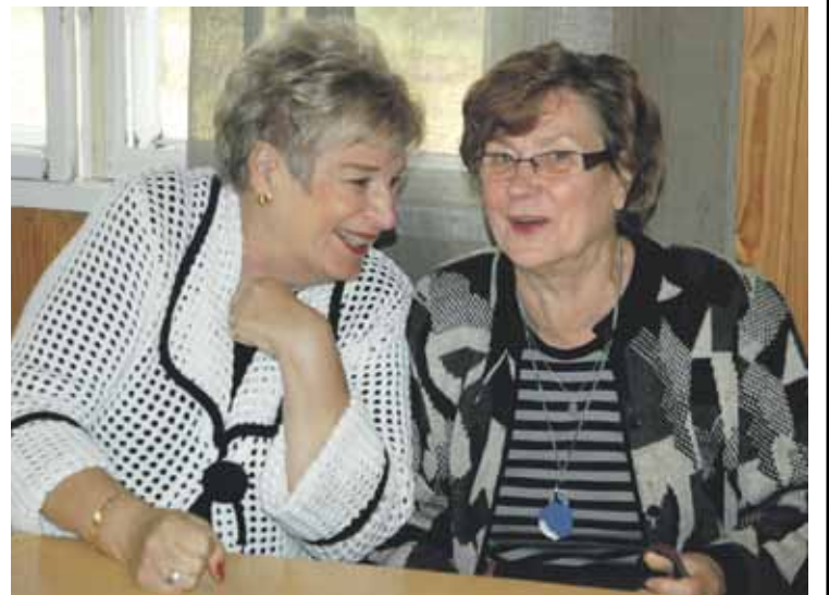
Kuulumisia on aina yhtä mukava vaihtaa