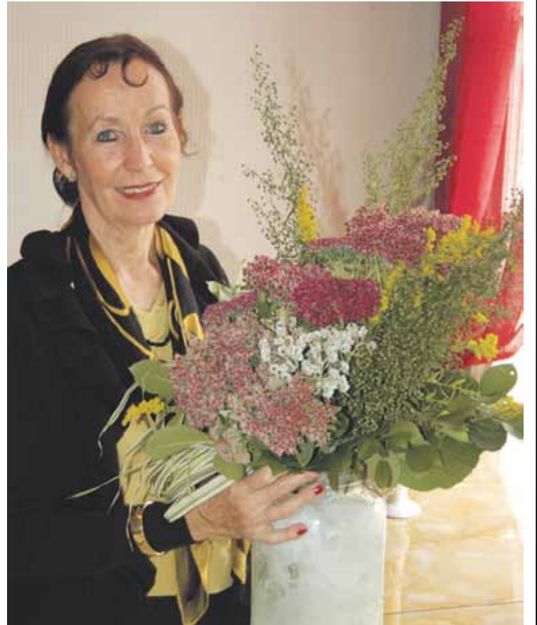
Porvoon Koivistolaiset olivat laittaneet juhlapaikan koreaksi

Yhtä mielenkiintoisena nähtiin mahdollisuus koota Koiviston historiaa, kuvina ja tarinoina virtuaaliseen museoon. Olisi mah-