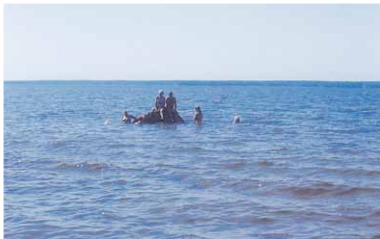
Rossin Mairelle oli tärkeää päästä vielä hepokivelle ja pääshä tuo.

Sunnuntaina oli kotiin-lähtö. Haimme Saarenpääst-tä tulijat mukaan ja veimme kukat Koivistolaisten sankarivainajien muistomerkillle.