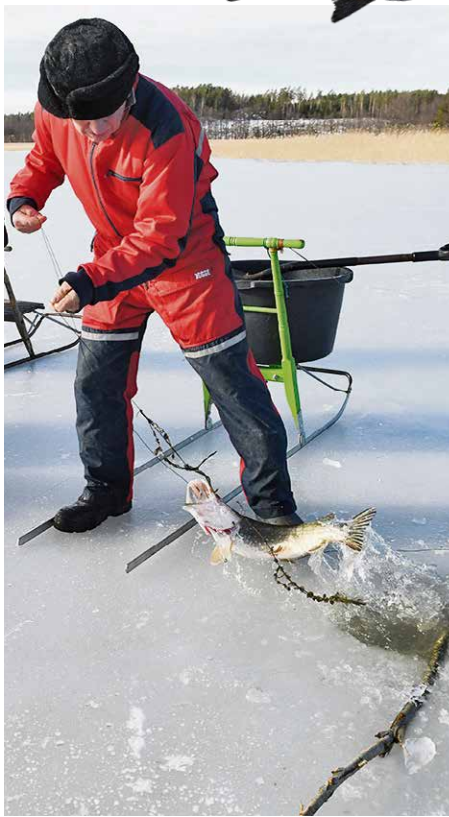
"Hauki pitää vetää heti pitkällä vedolla jäälle asti".

Nähtäväksi jää, saako kalastushomma jatkajan tyttären