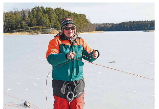
Eija kiskoi verkon takaisin jään alle.