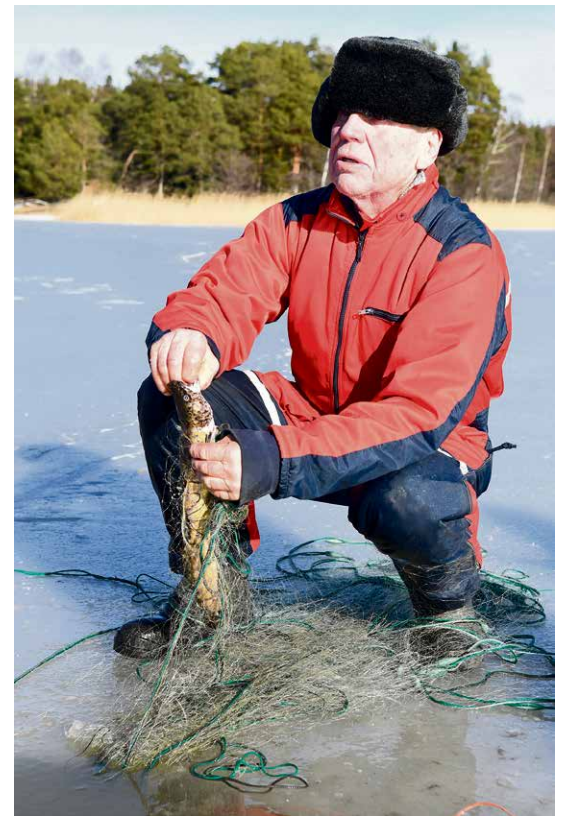
Made on rauhallisempi saalis.

Marin muuttaessa kesällä takaisin Suomeen islantilaisen puolisonsa ja pienen poikansa kanssa.