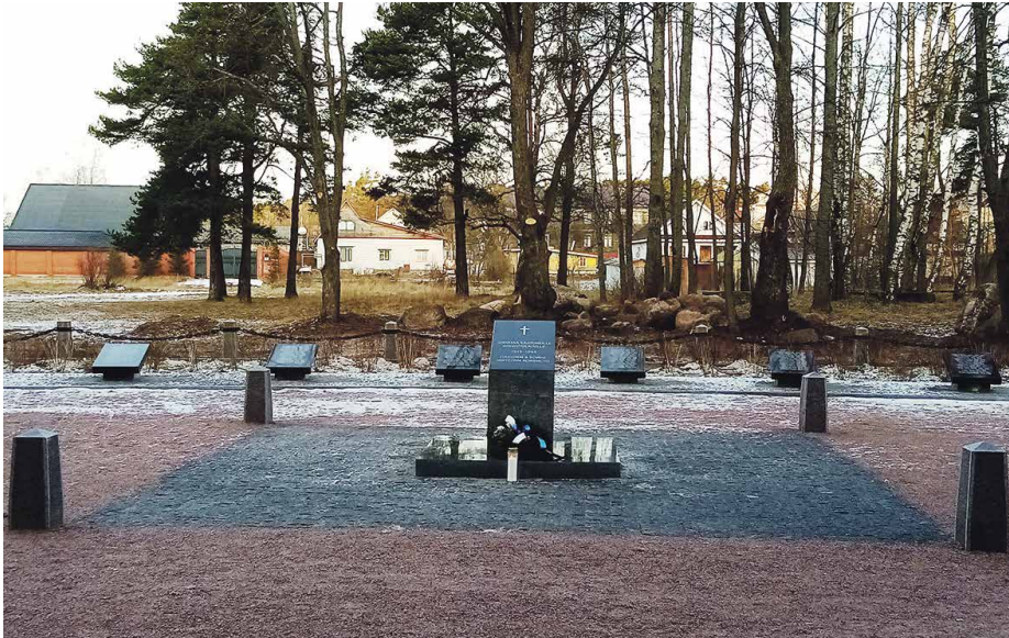
Koiviston sankarihauta v. 2020.

Kyselyn tavoitteena oli saada sankarihautausmaita koskevat tiedot talteen sähköiseen tietokantaan, jota voidaan käyttää hyväksi keskusteltaessa Venäjän federaatio-, alue-, piiri- ja paikallistason viranomaisien kanssa sankarihautausmaita hoitamisesta ja suojelemisesta niiden säily-