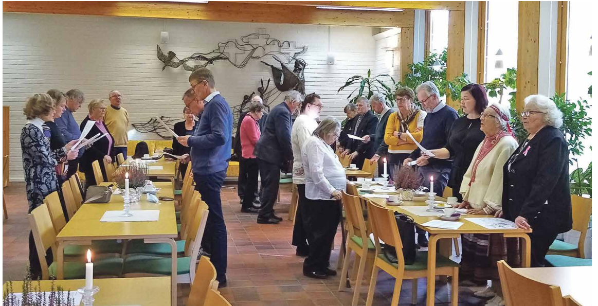
Kirkkokahvit ja ohjelmaa Särkisalons seurakuntatalossa.