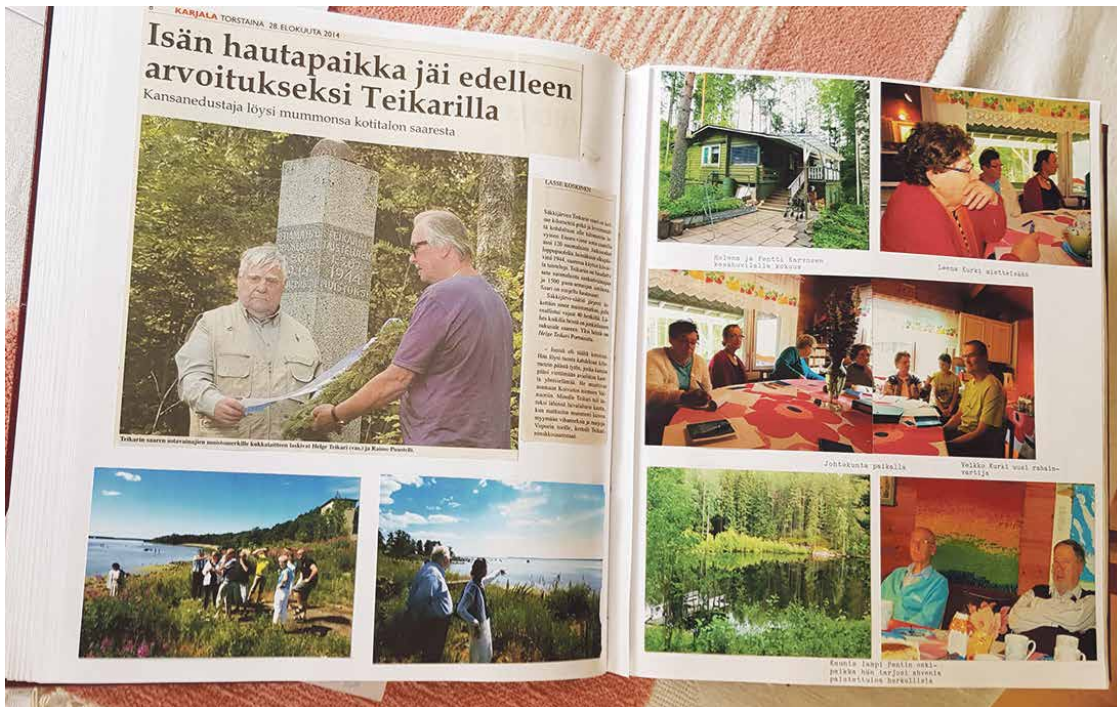
Leikirja auki sivulta Koivistolla käynti.

Seuran toiminnan kohokohdat arvoisissa kansissa.