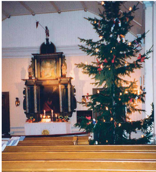
Askolan kirkko jouluna.

Lestadiolaisten tapojen seuraajina kävimme jouluseuroissa, joita pidettiin kodeissa, myös meillä. Joku kiertävä saarnamies oli kutsuttu esimerkiksi Saarenpään, minne sitten jollakin tavalla mentiin. Isä teki jossakin vaiheessa oman veneen. Se oli vielä ainakin Raumalla, missä soutelimme ja isä kalasti. Kalareissuille isä otti Valman mukaan, kun kuulemma sitten oli hyvä kalonni.