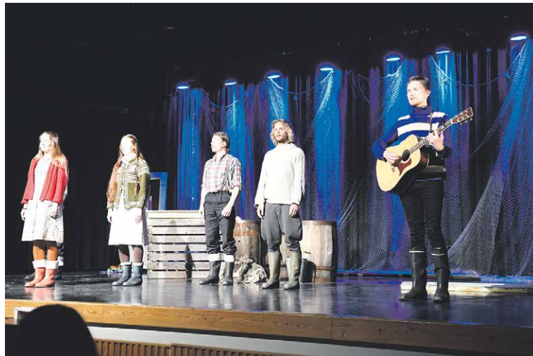
Meriteatterin Laulu on meren laulu -esitys.

Koivistolaisuus on Salokanteleelle mielentila. Se on myös muistoja, sukulaisuutta, kaipuuta