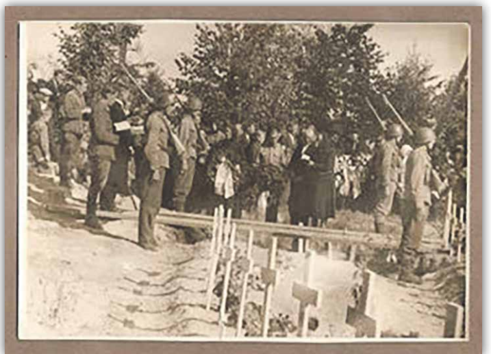
Sankarivainajien siunaus Koivistolla 1943