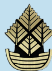
Pronssilaatta 35 e