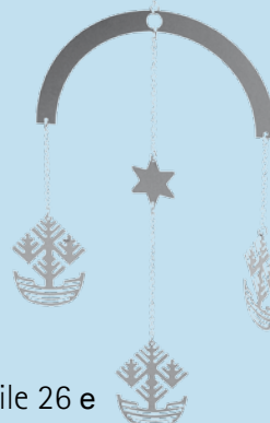
Mobile 26 e