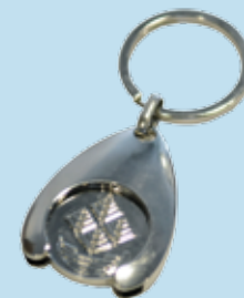
Avaimenperä 3,50 e