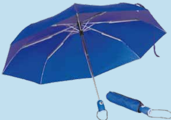
Sateenvarjo Koivisto-logolla 15 e