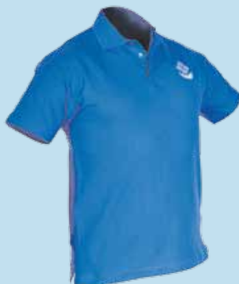
Pikee paita 15 e