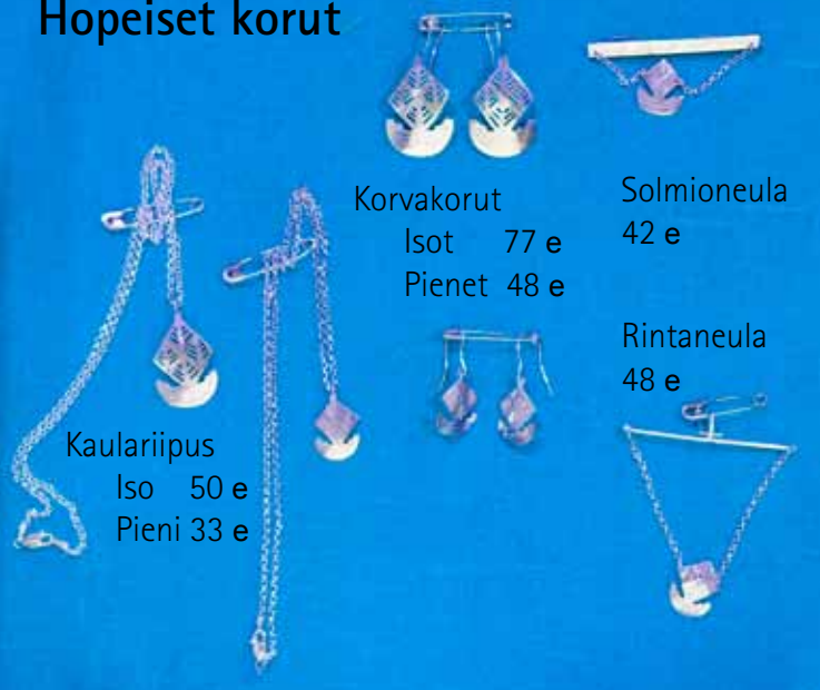
Korvakorut Isot 77 e Pienet 48 e