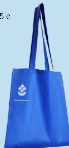
Kassi 3 e