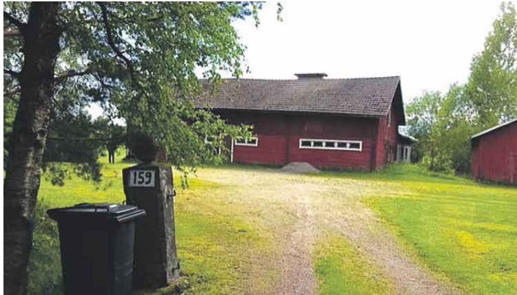
Vanhan pappilan ulkorakennus