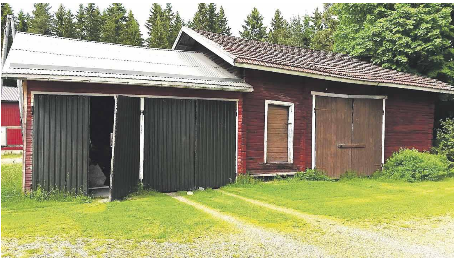
Vanhan pappilan sivurakennus

sitkee seuraavan vuon, eikä äit jaksant enää tapella papi kans, vaa pes "sali" lattia enne rippikouluu ja rippikoulu jälkee, ko Askoha konttas viel lattial.