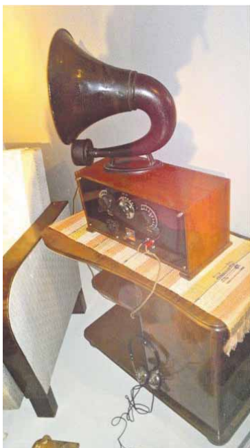
Kideradio Lahden Radiomuseossa

Keittiös ol pien puuhella, mil äit keitti meil ruuat. Isommas "salis" ol viel valtava leivinuuni, minkä pangol ol lämmintä loikoilla sil, kuka siel nukku. Isommas huonees ol penkit seinustoil, ja niie pääl myö lapset saatii nukkuu yöt. Päiväl pit ellää "suures salis" (= ulkoon) silloko pappi pit rippikouluu sisäl. Pappiha ois kyl voint ajjaa pyörällä kirkol, mis nii hänel ko rippilapsilki ois riittänt tillaa, ja riittiki sillo, ko äit kirjotti ministerrii. Mut pappi ol