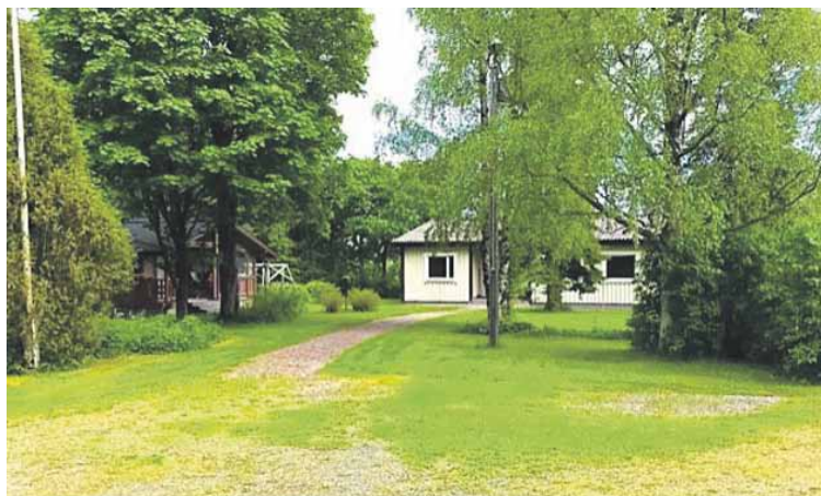
Asuinrakennus entisen pappilan paikalla