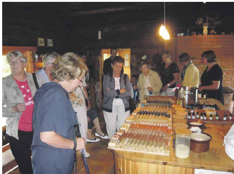
Luomutila Good Kaarman tuotteisiin käytetään mm. paikallisia yrttejä, terveellistä meren mutaa, tervaa ja hunajaa.