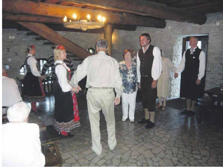
Tanssijat saivat vedettyä muutaman ”Kurkeakin” mukaan tanssin pyörteisiin

niisti remontoitussa kylpyläravintolassa Kuursaalissa nautitun illallisen jälkeen suuntasimme piispanlinnan vallihautojen toiselle puolelle Kuussaaren Oopperajuhlille. Linnan siltaa pitkin