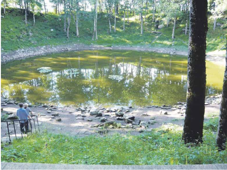
Kaali järv eli kansan suussa ”Pohjaton lampi” on erikoinen geologinen luonnonilmiö Saarenmaalla.

oli Saarenmaan pohjoisrannikon nähtävyyksiä. Tutustuimme saippuan valmistuksen saloihin virolais-englantilaisen yrittäjäperheen luomutilalla Good Kaarmassa.