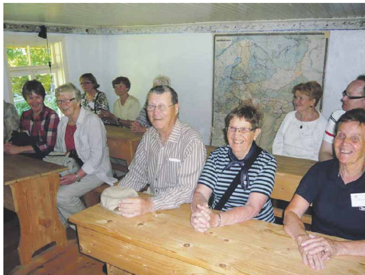
Porukkamme ahtautui sen paripulpetteihin ja juttu luisti.