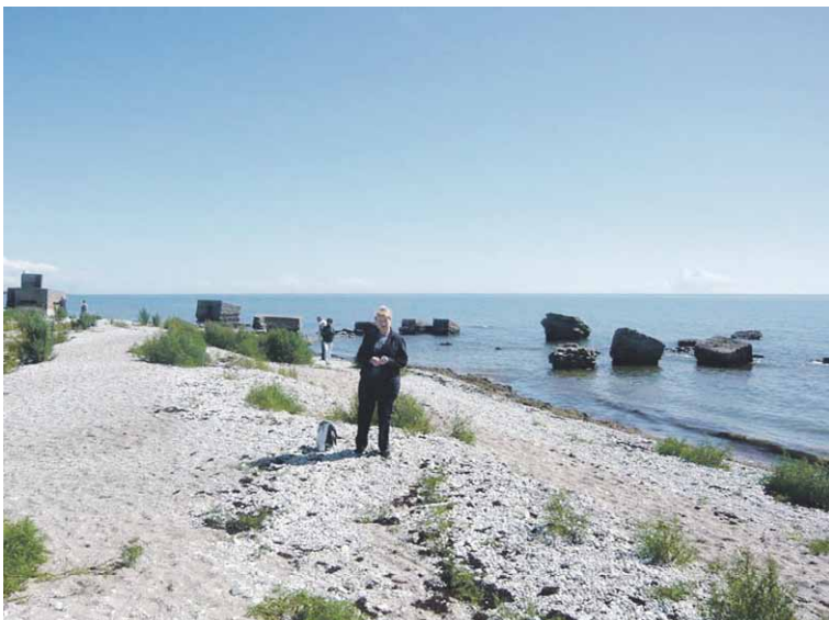
Sörven niemi on Saarenmaan eteläisin 40 km pitkä niemi, jonka kärkestä voi tiiraila Latvian puolelle.