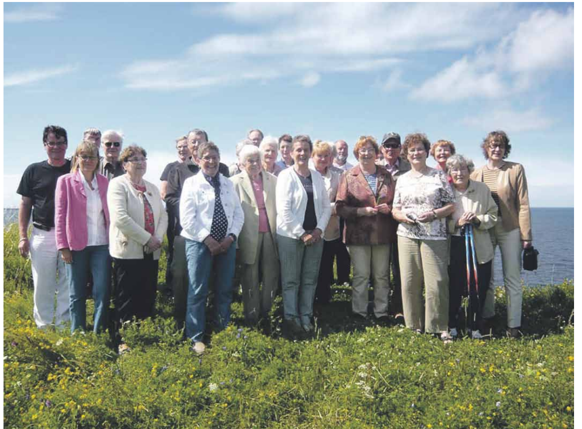
Yhteiskuvaa ottaessamme nopeimmat Kurjet olivat jo ”lentäneet tiehensä”.

– ruiskaunokki. Ennen vanhaan myös viimeiselle matkalle lähtevien ”puupaltoon” päälle haetaan laitettiin tällainen kirjottu peitto.