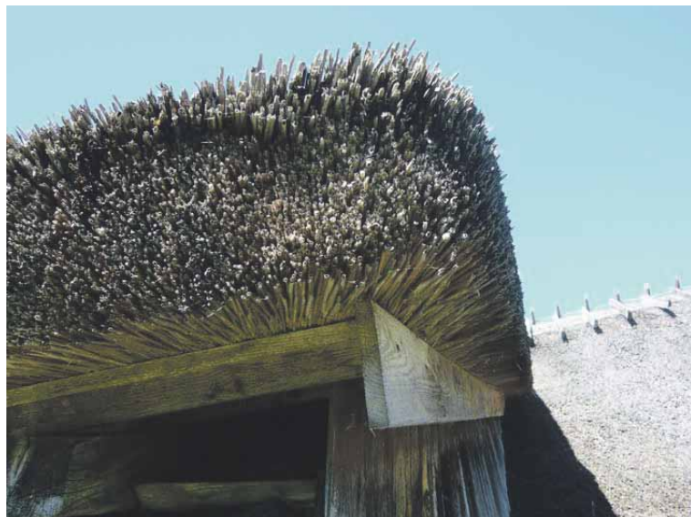
Meriruokokatto on vedenpitävä ja kestää parikymmentä vuotta.

Tietenkin muisteltiin omia kouluaikoja Koivistolla ja muualakin. Esillä oli perinnekeisärit. Hyvin kauniita ja värikkäitä ovat Muhun villaiset kansallispuvut kirjailuineen. Muhu-saaren naisihanne on aina ollut vankkatekoinen ja vahvajalkainen työhminen. Sen vuoksi hoikemmat neitokset käyttivät useita paksuja kirjottuja villasukkia, jotta ”pääsisivät naimisiin”. Seinille ripustettujen suuritöisten seinävaatteiden suosikkiaihe näytti olevan virolaisten kansalliskukka