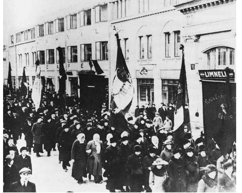
Tsaarin kukistumista juhlittiin Turussa maaliskuussa 1917. Kuva kirjasta Ihmisen tiet, Otava

Olivatko tarkastajat jo käyneet Koivistolla, koska asia käsiteltiin toisin. Kokouspöytäkirjan mukaan: "Kun saariston kansa on sodan pelon tähden pakotettu pois muuttamaan asunnoistaan niin keskusteltiin mihinkä siellä olevat kunnan vaivaiset sijoitetaisi ja päätti kokous että Waiwashoitohallinnon on mantereen puolelle järjestettävä kunnan varoilla väiaikainen vaivashoitola