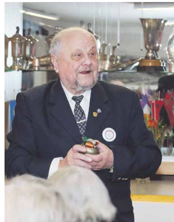
Unto Jack muistelee Turun Karjalatalon ja paikallisen Koivistoseuran syntyä.