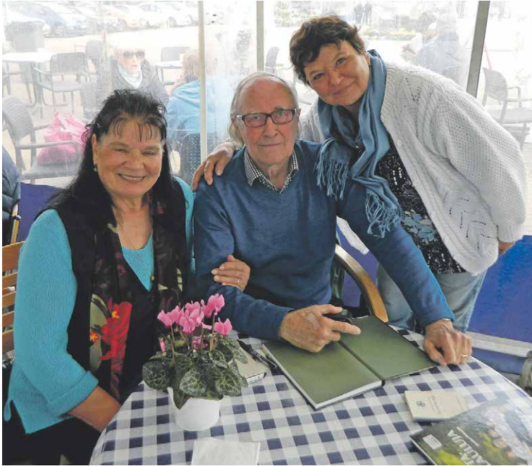
Kaukainen muisto laulun tekijät ottivat kirjantekijältä kiitollisuudella lahjakirjat vastaan aamukahveilla Haminan torilla.