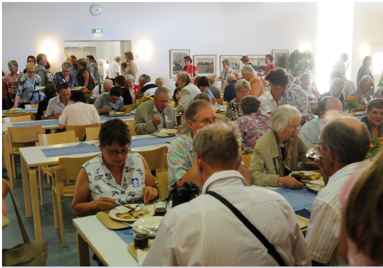
Juhlakansa valtasi koulun ruokalan.