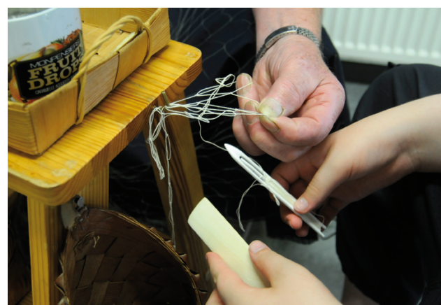
Ollilla oli työn alla santalo, verkon yläreuna.