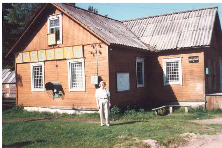
Erja Tikka isä-Arvon kotitalon pihalla 1991.

Käykääpä muutkin koivistolaiset kotiseutumatkoillanne ”Tikan kaupassa”!