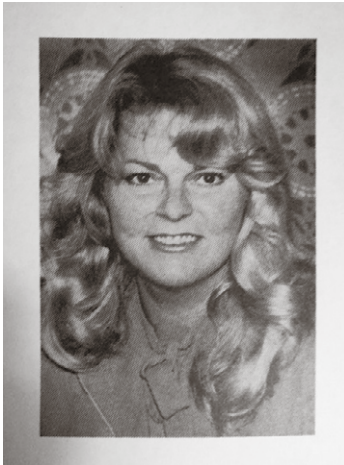
Nuori matkailupäällikkö

Suoritettuaan ylioppilastutkinnon Imme sai AFS-järjestön stipendiaattina oppilasvaihto-ohjelmassa suorittaa amerikkalaisessa Hazelwood High Schoolis-