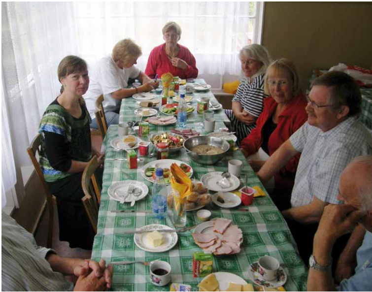
Ruokapöydän äärellä Hotelli Vilhelmissä.

mosees kunnos, ko se sil hetkeel oli. Hiljane kiitos sil Primoskiis, - Koivusaarees - syntyneel lahjottajaal, minkä ansioost katto oli pystytty korjaamaa ja tää arvokas koivistolaisii ajoist kertova muistomerkki sai taas lissää ikkää.