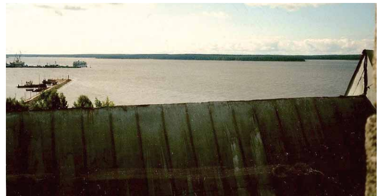
Aallonmurtaja Kirkon tornista nähtynä.

olisi saanut mahdollisimman hyviä otoksia.