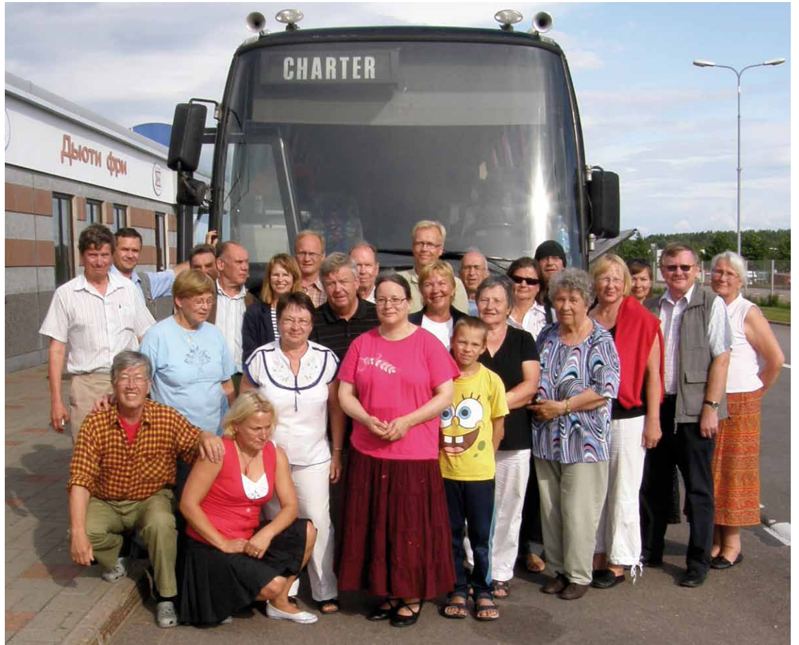
Retkeläiset yhteiskuvassa Torfianovkan raja-asemalla rajakaupan edessä.

Siin ko Ruiskupis kävijät käveliit sammaa polkuu. takasii hotelliil päi ol sama kissa taas hoiit vastaa ottamaas. Kävel siin häntä iloseest pystyys hoi mukannaa takasii kotiisa päi. Tais varmistaa, et hyö osasiit männä oikiaa suuntaa. Ystäväl-