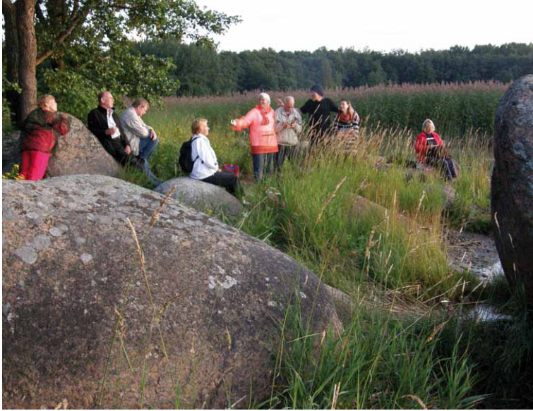
Retkeläisiä Ruiskupin niemessä, taustalla Kaukiaisien lahti.