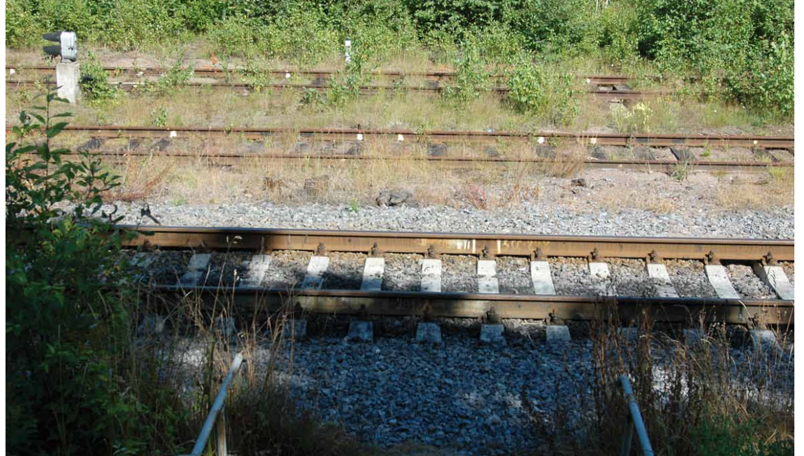
Koiviston rautatieasema oli monen evakkoon lähtijän lähtöasema.