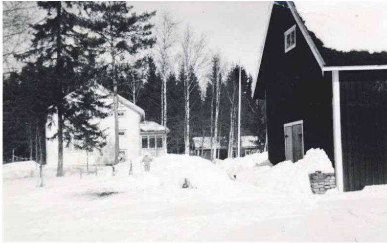
Ilmastin tilan talvista pihapiiriä.

Pienen suoran päässä tieltä erkanevalla vasemmalla kapealla pihatie, jonka päässä on Ilmastin talossa asuneen toisen tyttären perheen (vanhempani) 60-luvun alussa ra-