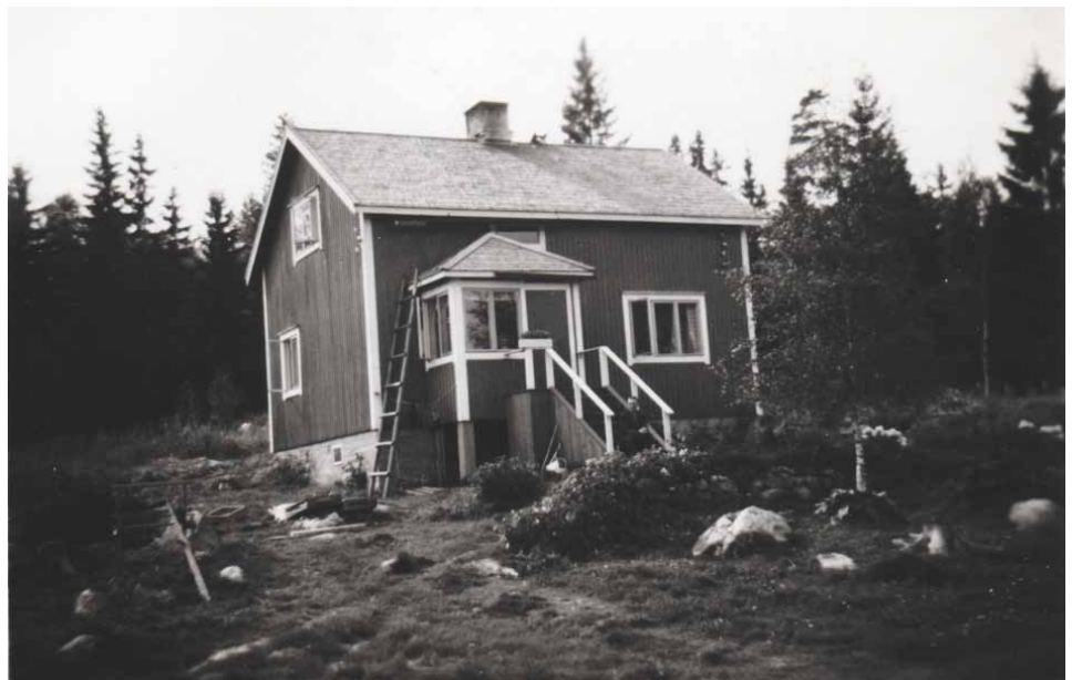
Skaftkärrintie päättyi noin 100 metriä ennen Tölliköitten asuttamaa Peräpelto -nimistä tilaa. Nimi kertoo paljon paikan syrjäisyydestä. 1950-luvun alussa rakennettu talon pihapiiri oli vielä keskeneräinen. Tilaan kuului lisäksi navettarakennus ja saunarakennus.