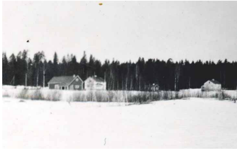
Ilmastin tilan rakennuksia.

Mieleenpainuvaa on ollut myös tämän pojan suhde mummoonsa, koska vielä yli 50-vuotiaanaakin hän kaivoi joskus lompakostaan vanhan valokuvan, jossa mummo seisoo pellolla lehmänsä kanssa.