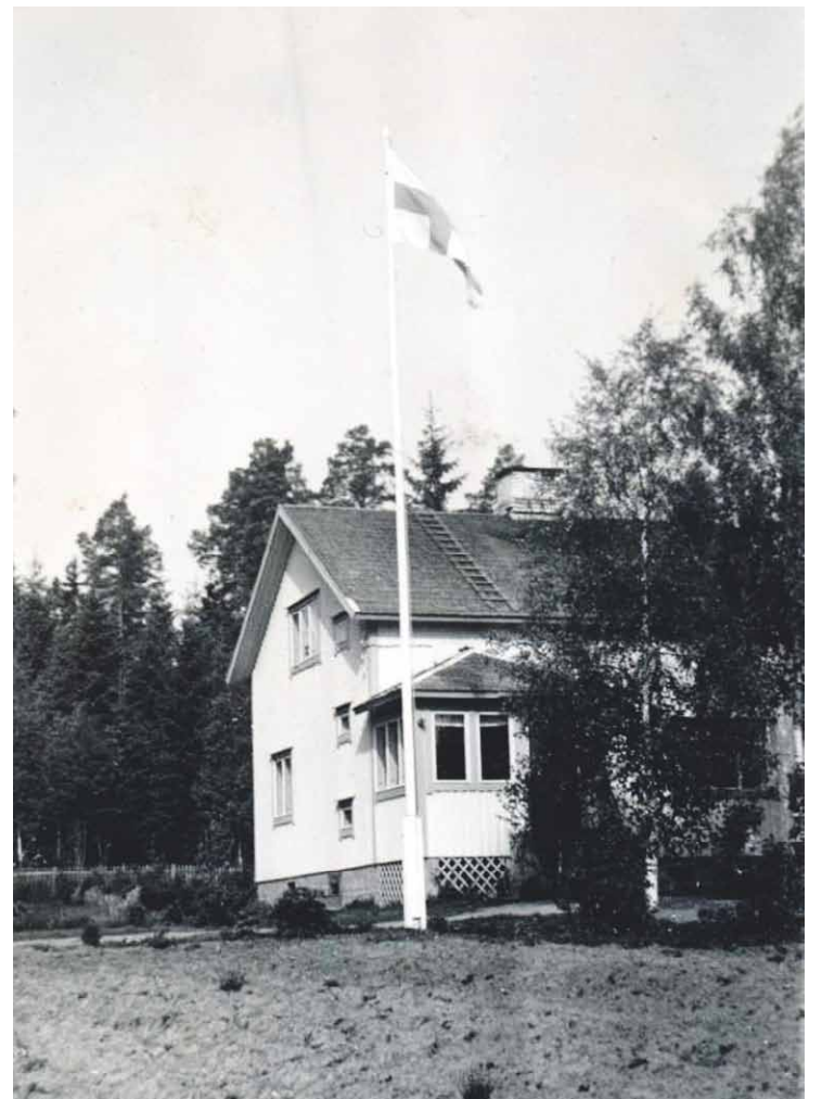
Juhlaliputus Ilmastin tilalla.

Kaukiaisten tilan karjaa aitauksessaan. Heinänteon jälkeen lehmät saivat nauttia tuoretta heinää kettinkiin kytkettyinä.