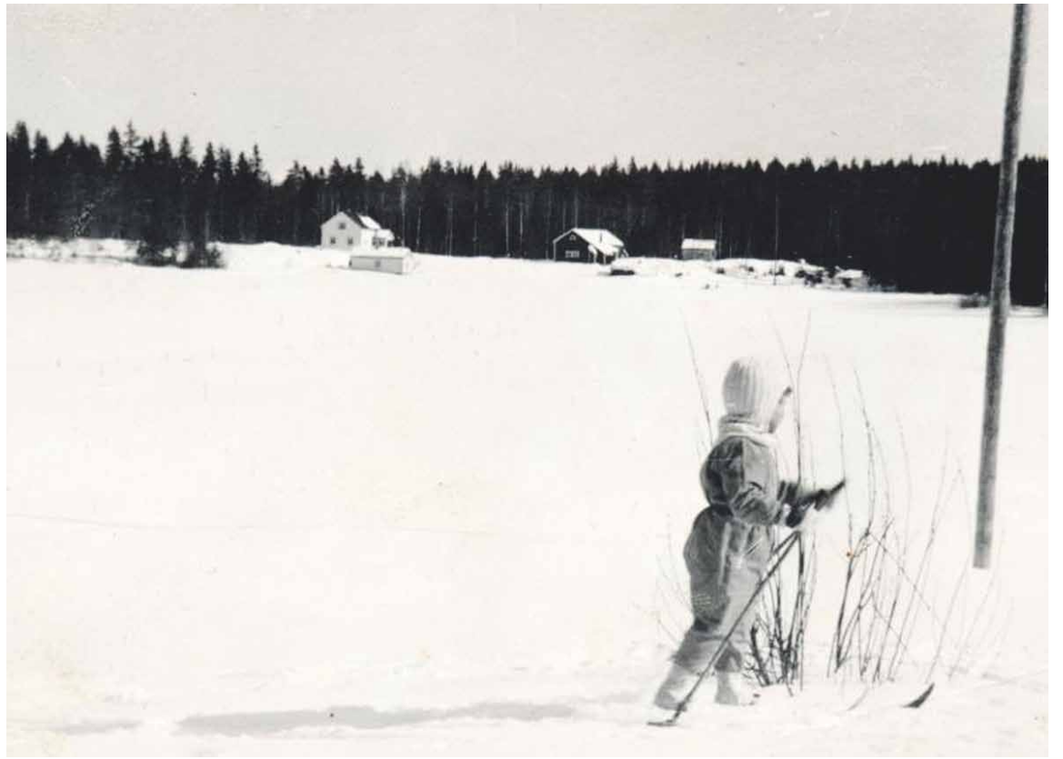
Karvasen tilan rakennukset pellon toisella puolella.