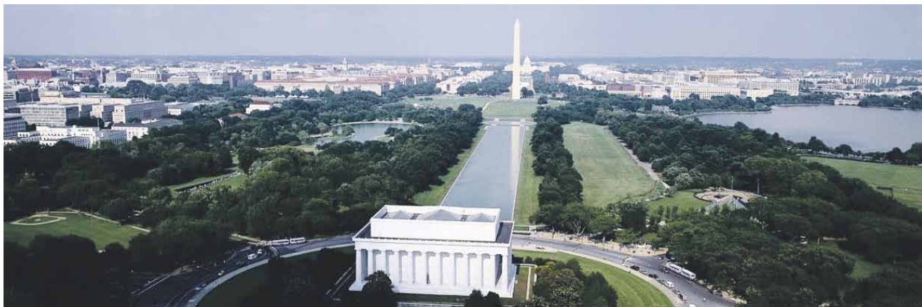
Lincoln Monument (edessä), takana Kongressin rakennus ja Washingtonin muistomerkki välimaissa