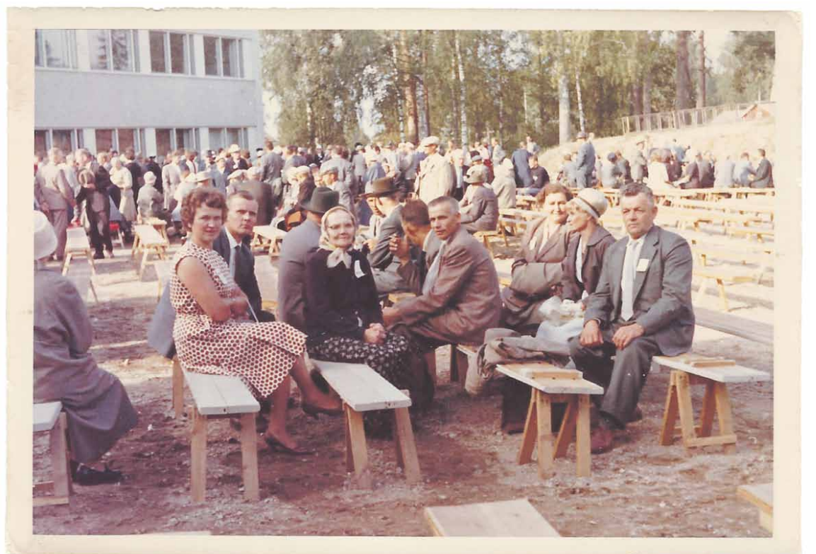
Tulevia Koivisto-juhlia ootellen kuva Mäntsälän juhlilta v. 1961