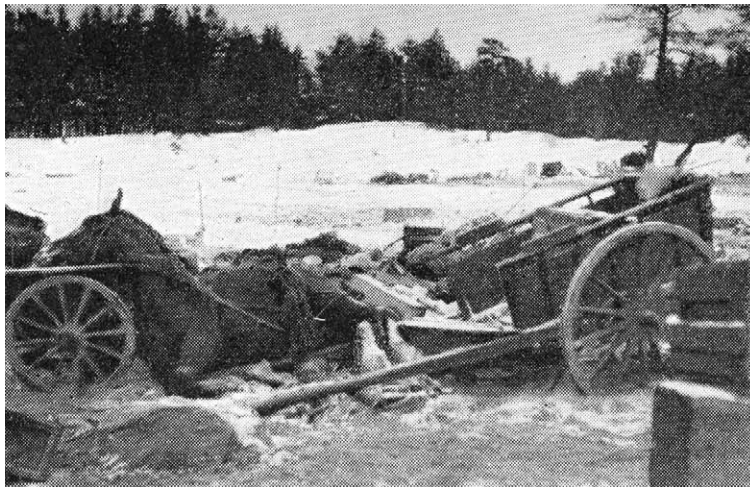
Venäläisten jäämistöä Tiurinsaarella saaren valtauksen jälkeen.