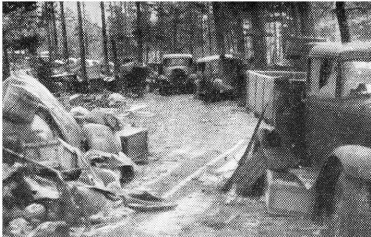
Putronhiekan mottiin jääneitä autoja ja elintarvikkeita.

Suomi jopa kotiutti vanhempia ikäluokkia syksystä 1941 alkaen. Kotirintamahan kaipasi ”työmiehiä”. Kotiuttamisia toteutettiin enimmäin juuri Karjalan kannaksella.